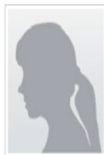
Safiye Pedersen Suppleant - På valg