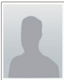
Casper Sparre 2. suppleant