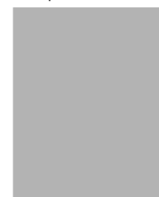
Mangler Suppleant - På valg