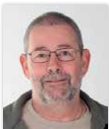
Steen Købsted Formand