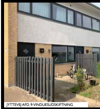
JYTTEVEJ AFD. 9: VINDUESUDSKIFTNING