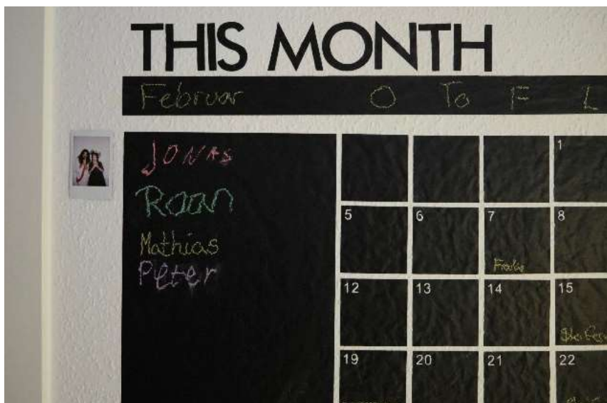
Månedspalten føres omhyggelig .