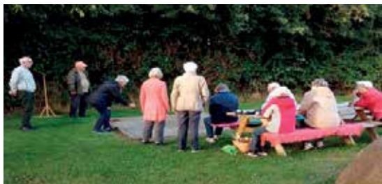
Så spilles der

Med hensyn til aktiviteter i vinterhalvåret må vi se, hvilke udmeldinger der kommer fra myndighederne og Vivabolig.