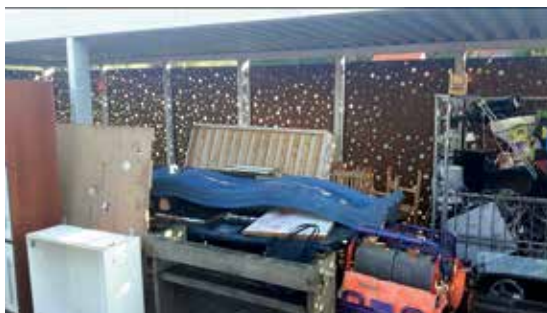
Affaldsgården en tilfældig dag

Ifølge arbejdsmiljøloven skal de nemlig være to mand til at håndtere mange af tingene, hvilket koster mange penge og ressourcer. Vi ser ofte, at mange beboere, når de smider møbler og andre store ting ud, kommer med tingene i en trailer. Det havde ikke haft den store betydning i stedet at køre tingene på genbrugspladsen. I skal huske en ting: det eneste sted afdelingen får penge fra, er fra beboernes lommer. Så det er rigtig vigtigt, at vi alle tænker os om.