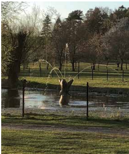
I en lille båd der gynger sidder Rasmus og synger.

Det blev så selvfølgelig lidt sværere at servicere pumpen, så teamet anskaffede en brugt plastik jolle, og nu ser det ud til at virke.