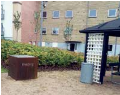
Klar til NÆSTE grill-sæson.