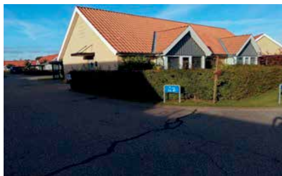
Her ses det flotte resultat

Renovering af vinduer og døre er nu afsluttet i uge 38. Så nu fremstår hele afdelingen med nye vinduer, døre og ny beklædning på karnapper samt overdækninger over yderdøre.