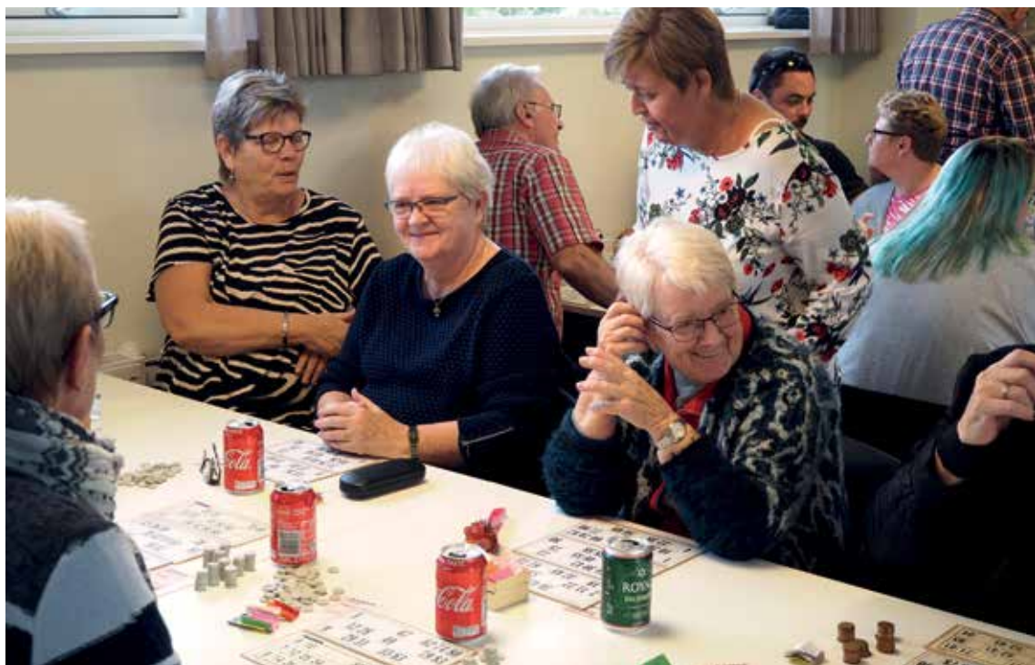
Der var engang!

En rigtig glædelig jul og et godt nytår!