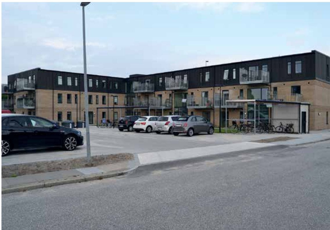
Her ses det færdige resultat efter indflytning.