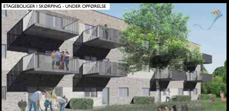
ETAGEBOLIGER I SKØRPING - UNDER OPFØRELSE

ARKITEKTFIRMAET NORD A/S KJELLEUPSGADE 22, 9000 AALBORG WWW.NORD-AS.DK 99352000