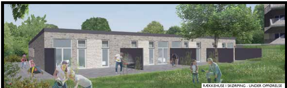
RÆKKEHUSE I SKØRPING - UNDER OPFØRELSE