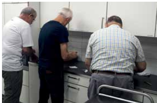
Stemmeudvalget i arbejde

Det samlede referat kan findes på hjemmesiden eller rekvireres på Ejendomskontoret.