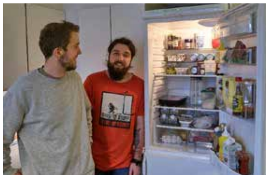
Vi kendte hinanden rigtig godt fra højskolen, så vi vidste, hvad vi gik ind til.