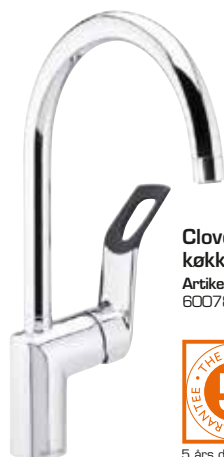
Clover Easy køkkenbatteri