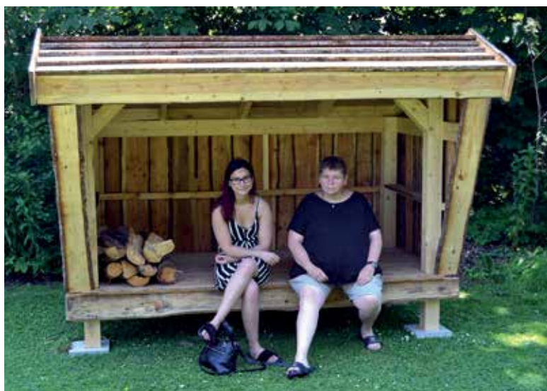
Shelters er taget i brug.