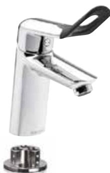
Clover Easy håndvaskbatteri