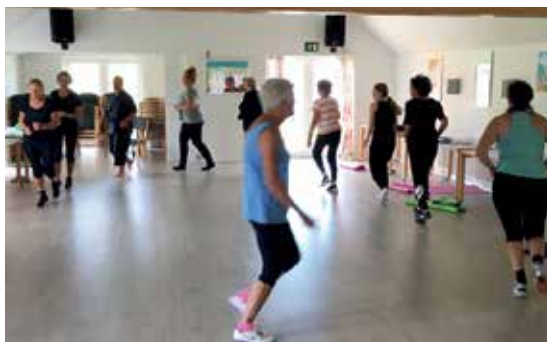
Der motioneres med ynde.

Har I lyst til at deltage, så kontakt Helle Højen. Så er vi sikre på, at der ikke for mange deltagere.