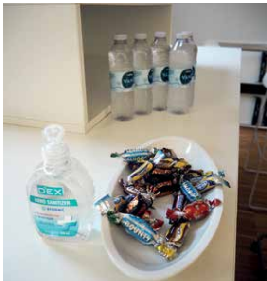
Et beskedent traktement!

Regnskabet viste, at afdelingen kom ud med et nydeligt overskud, og dette var – sammen med effektivisering af driften – medvirkende til, at forsamlingen med glæde kunne godkende næste års budget UDEN huslejestigning.