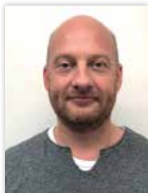
Per Rimmen Afdeling 7