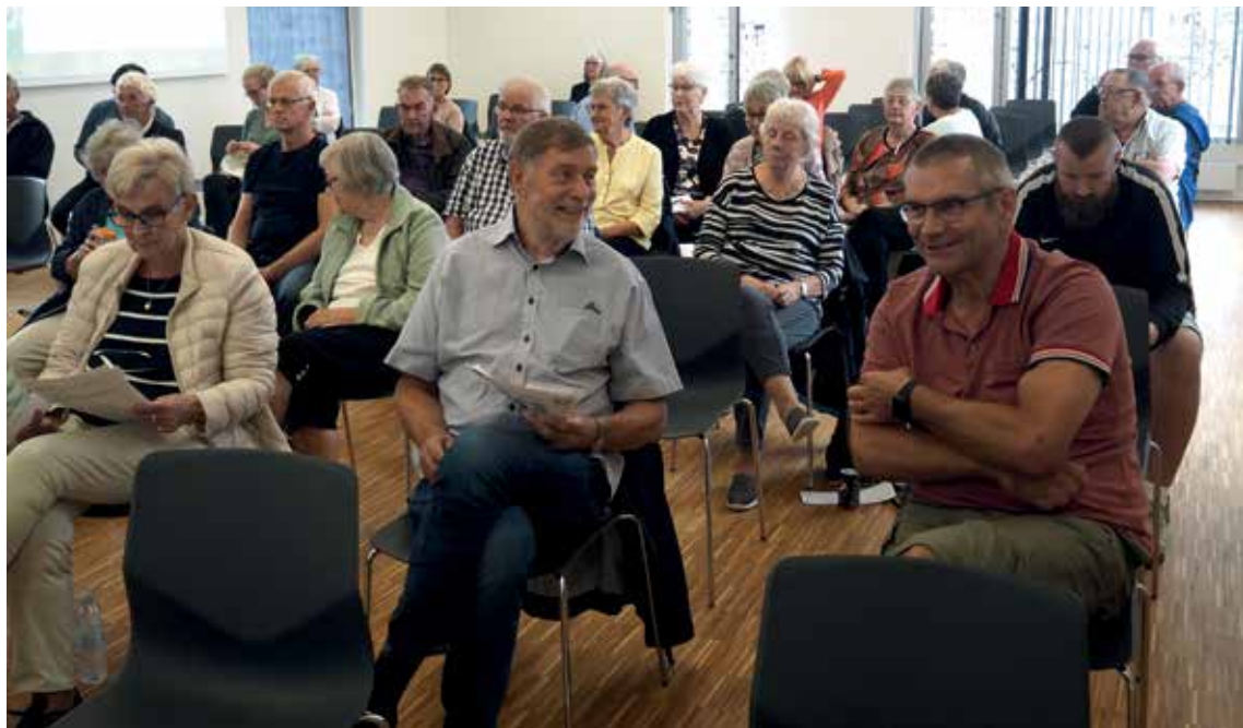
Stolerækkerne blev fyldt.