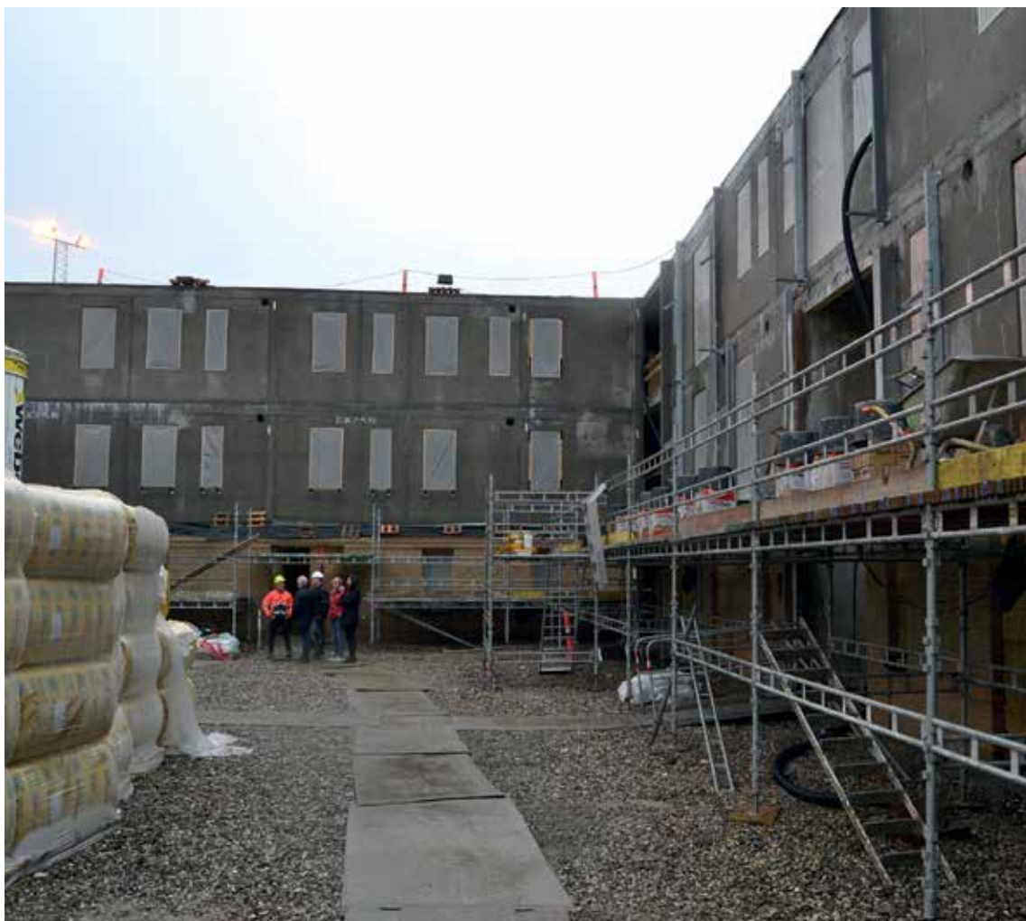
Kærbyhus set fra Asylvej til rejsegildet

Vi er stolte af resultatet - forsidebilledet samt de øvrige billeder taler for sig selv.