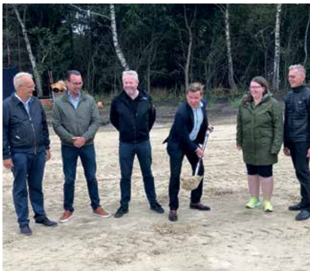
Borgmesteren tager første spadestik