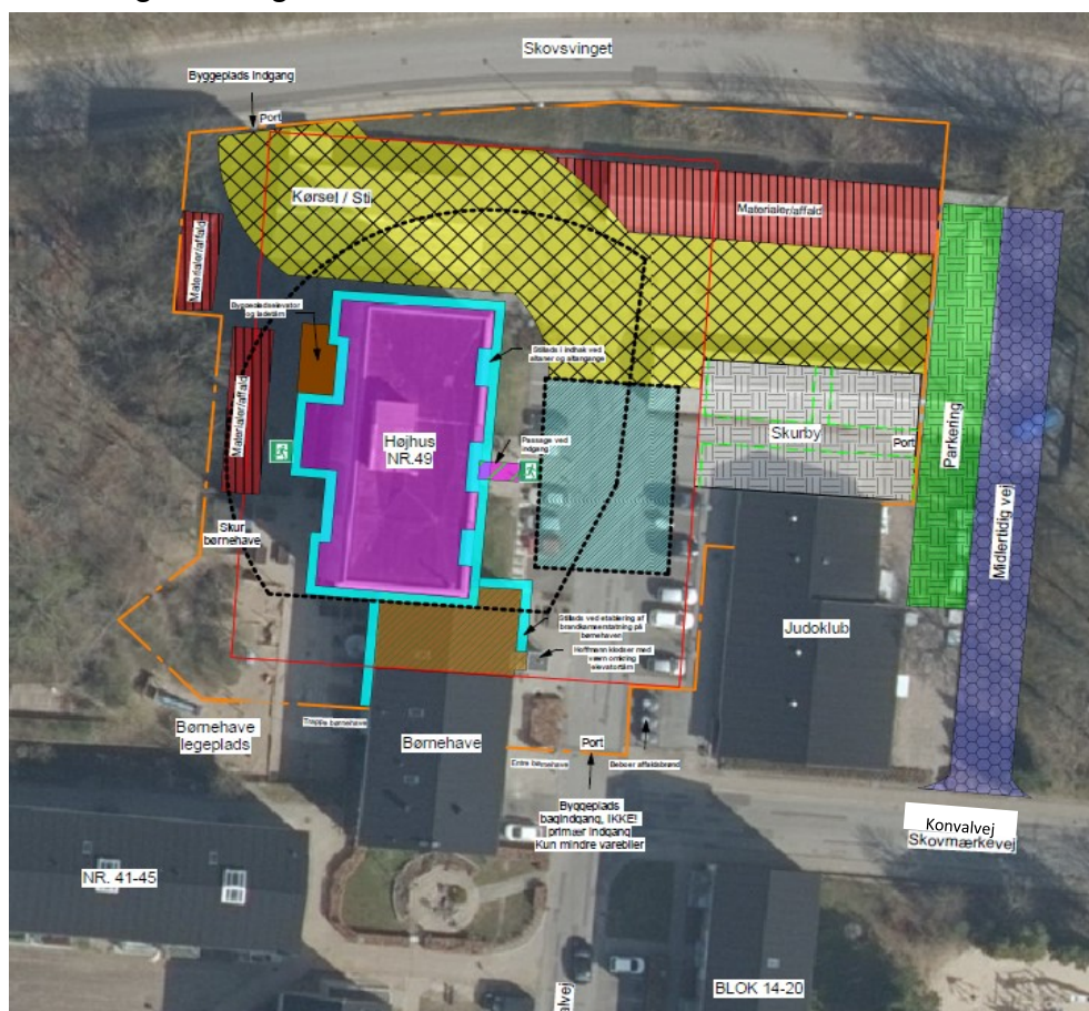
Byggepladsindretning under opførelse