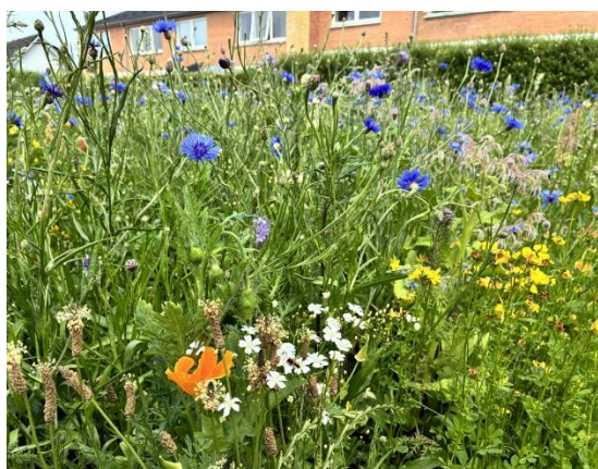
Billede fra Hvedevænget