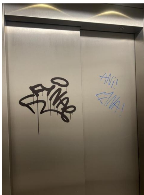
Billeder af hærværket